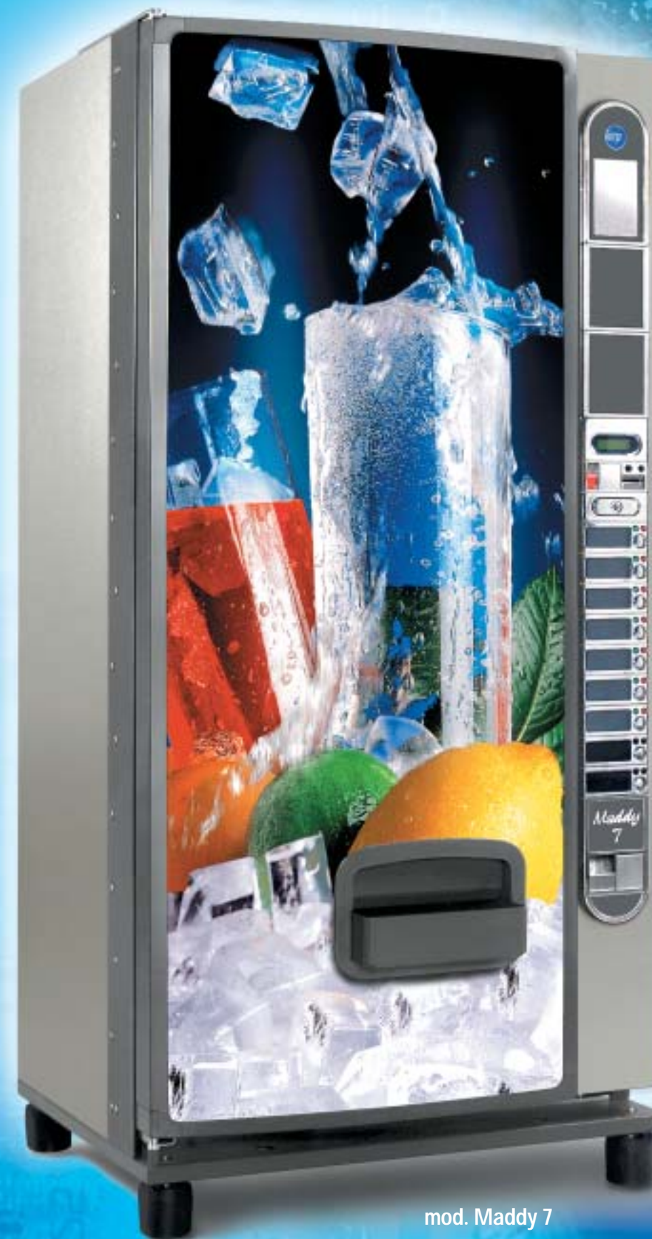
mod. Maddy 7