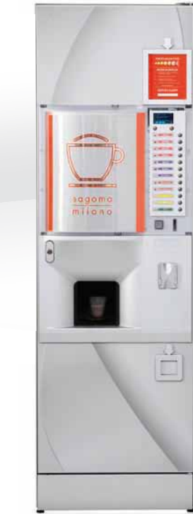
SAGOMA MILANO INSTANT/ESPRESSO