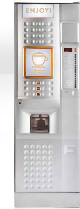
CAFFE' EUROPA INSTANT/ESPRESSO