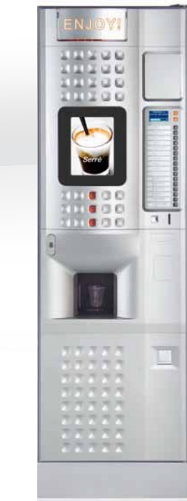
CAFFE' EUROPA MULTIMEDIA INSTANT/ESPRESSO