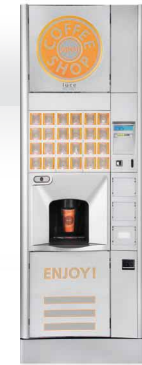
LUCE X2 INSTANT/ESPRESSO