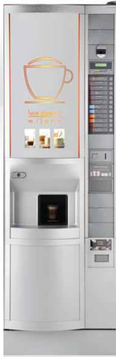
SAGOMA LUCE INSTANT/ESPRESSO