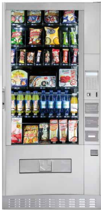
LUCE X SNACK