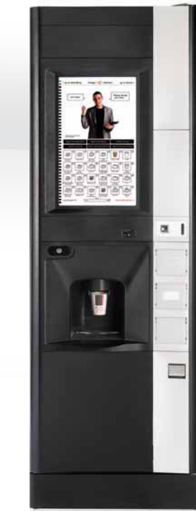
LUCE X2 touchTV INSTANT/ESPRESSO