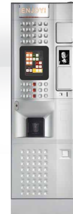
CAFFE' EUROPA MULTITOUCH INSTANT/ESPRESSO